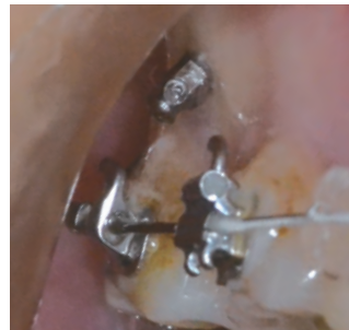
アブソアンカーならではの斜め打ち