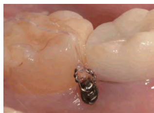
歯間乳頭部にヘッドを出すことも可能

最細1.3mmからのラインナップ、スムーズなネック形状のため、狭い歯根間にも植立しやすく、根尖方向の広いスペースへ安全に植立することがアブソアンカーでは可能です!