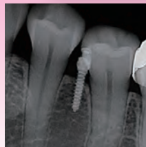
斜めに植立することで、歯根との接触リスクを低減できます。